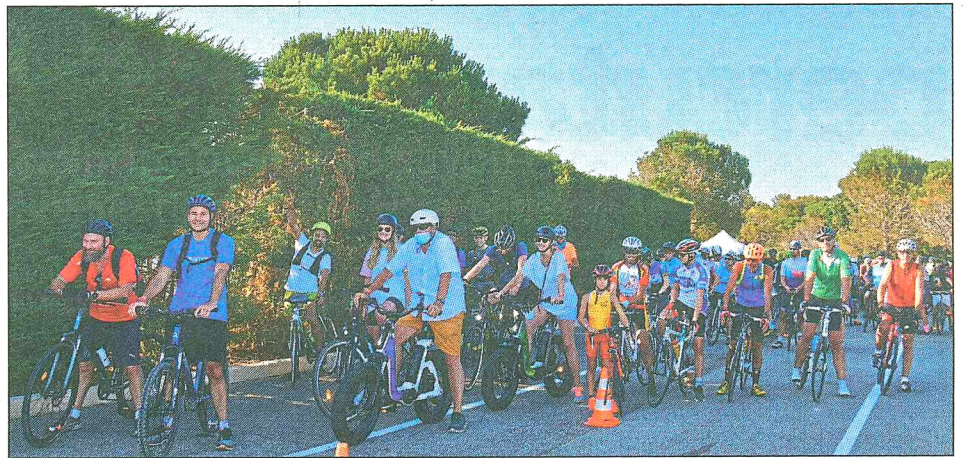
Plus de 250 passionnés de vélo, en famille ou en club ont franchi la grille de départ du circuit Paul-Ricard. (Photos M. M.)

Après avoir parcouru au choix les trois distances de circuit, 800 m, 3,8 km ou 5,8 km, les sportifs d'un soir ou plus, ont pu se détendre avec un service restauration mis à leur disposition. Le restaurant Panoramic a régalié tout ce petit monde avec salade, wok poulet et des pâtes à différentes sauces. De nombreuses tables