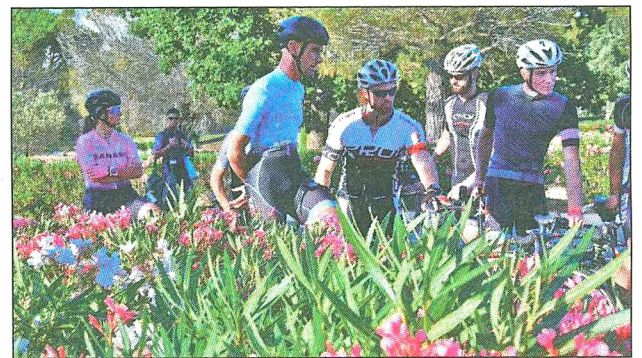
C'est dans une ambiance conviviale que les vélos ont pris le départ ce mardi pour parcourir le circuit de F1 Paul-Ricard au Castellet.